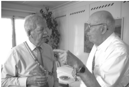
Samba und Rondo beim Smalltalk

Anschliessend genossen wir einen feinen Dreigänger: