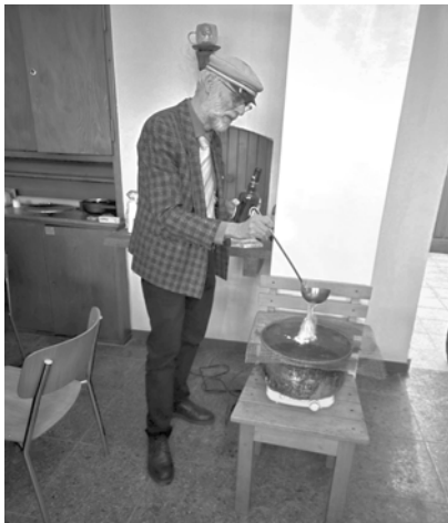
Tango unser bewährter Braumeister

Dann wurde es mit dem Chef-Brauer nochmals spannend: Tango zog alle Register und braute das ultimative letzte Crambambuli in unserem Keller mit allen Schikanen, ohne das Lokal abzufackeln.