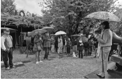
Die Kyburger mit Schirmen am Staunen

Nach dem Vortrag ging es zu einem geführten Rundgang durch den Park. Es hatte angefangen zu regnen. Mit Schirmen ausgestattet kam die Kyburgerschar nicht aus dem Staunen. Diverse Kunstobjekte waren mit Motoren ausgerüstet.