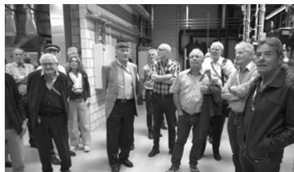
v.L. Pöik, Beno, Alla, Rocco, Repco, Izar, Samba, Achilles, Chili