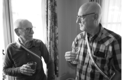
Pantschy und Repco