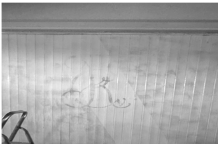
Verblichen ward sein Schimmer!

Nautus wiederum hatte sich bereit erklärt, die Wand mit dem Kyburger Wap- pen zu überstreichen. Als Hobby-Aquarellmaler war er für diese Mission ge- geradezu prädestiniert – zumindest aus Sicht des Vorstands. Am Montag, 1. Februar, und Dienstag, 2. Februar 2026, stand er im Einsatz. Drei Anstriche waren nötig, bis das Wappen nicht mehr sichtbar war. Mit gewisser Genug- tuung durfte Nautus annehmen, dass bei einer allfälligen vertieften Unters- suchung des Restaurants Krone durch die Denkmalpflege in den nächsten hundert Jahren vielleicht doch noch Spuren dieses geschichtsträchtigen Wappens auftauchen würden – als stilles Zeugnis der Kyburgia und ihrer Kellernutzung seit 1945. Sichtbar war davon nun zwar nichts mehr, ganz verschwunden war es aber trotzdem nicht. Manche Dinge lassen sich übermalen, aber nicht ganz aus der Geschichte wischen.