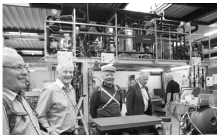
Izar, Achilles, Isidor und Eros