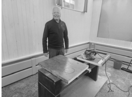
Isidor als «Gibmer» und «Häbmer»

Nautus wiederum hatte sich bereit erklärt, die Wand mit dem Kyburger Wap- pen zu überstreichen. Als Hobby-Aquarellmaler war er für diese Mission ge- geradezu prädestiniert – zumindest aus Sicht des Vorstands. Am Montag, 1. Februar, und Dienstag, 2. Februar 2026, stand er im Einsatz. Drei Anstriche waren nötig, bis das Wappen nicht mehr sichtbar war. Mit gewisser Genug- tuung durfte Nautus annehmen, dass bei einer allfälligen vertieften Unters- suchung des Restaurants Krone durch die Denkmalpflege in den nächsten hundert Jahren vielleicht doch noch Spuren dieses geschichtsträchtigen Wappens auftauchen würden – als stilles Zeugnis der Kyburgia und ihrer Kellernutzung seit 1945. Sichtbar war davon nun zwar nichts mehr, ganz verschwunden war es aber trotzdem nicht. Manche Dinge lassen sich übermalen, aber nicht ganz aus der Geschichte wischen.