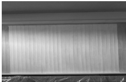
Übermalt aber nicht verschwunden