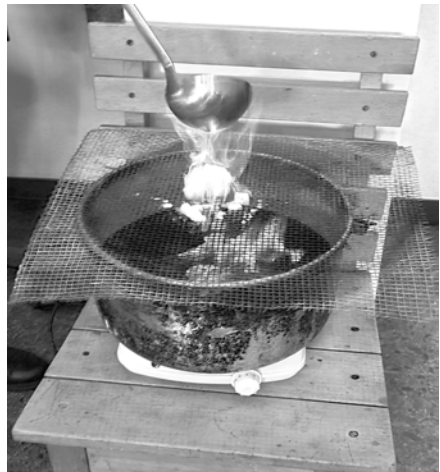
Das letzte Crambambuli in unserem Keller