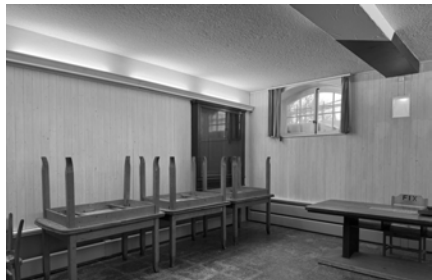
Der Vorstand nach der Reinigung des Kellers Der vermeintlich gereinigte Keller