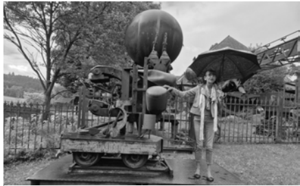
Die Dame welche die Tonnagen bewegte