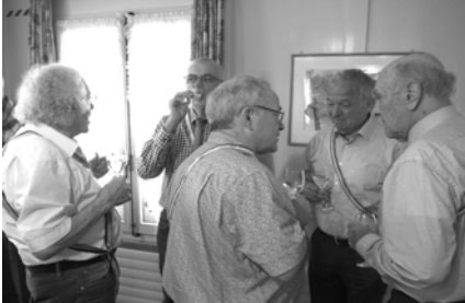
Borax, Tango, Izar, Eros, Alla