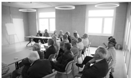
Die aufmerksamen Kyburger beim Vortrag über die CTA