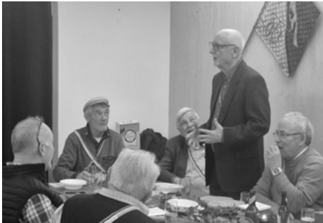
Rocco, Calvados, Repco und Izar im Stall

Ausserdem gab es viele Kanten und Witze, die zum Besten gegeben wurden.