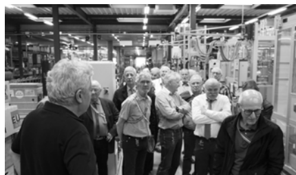
v.L. U. Mürger, Kari, Rondo, Rocco, Achilles, Izar, Nautus, Pantschy