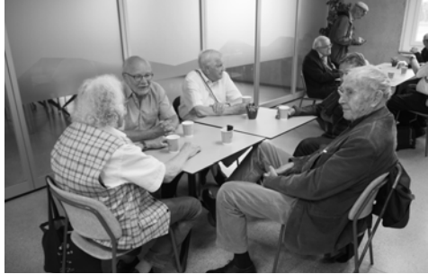
Borax, Joule, Calvados und Gnomon beim Kafi