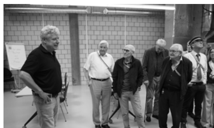
v.L. U. Mürger, Calvados, Pantschy, Gnomon, Beno, Ajax Kyburgia Winterthur