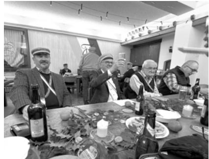
Fendant, Lignum, Beno und Sahib im Stall

Und dann auch noch Beno, der ewige Zauberer mit immer wieder neuen Darbietungen.