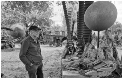
Tango unser Braumeister beim Staunen