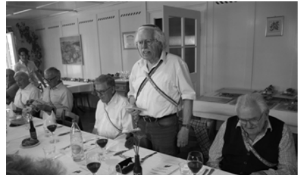
v.L. Calvados, Eros, Lignum, Kantusmagister Borax und Beno