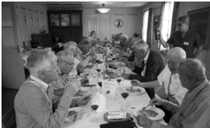
v.L. Achilles, Izar, Calvados v.R. Pöik, Samba, Kent beim Mittagessen