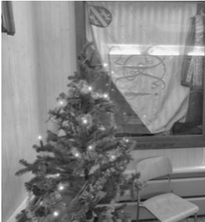
Das letzte Mal erleuchtet

Nach der Verschiebung vom Stadthaus in den Keller konnte es losgehen. Wie schon seit Jahrzehnten erwartete uns der dauerhaft geschmückte Weihnachtsbaum. Zum letzten Mal, denn am 31.01.2026 geht der Keller zurück an die Liegenschaftsbesitzer.