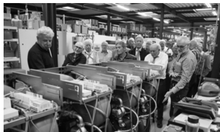
v.L. U. Mürger, Pantschy, Borax, Joule, Chili, Rondo, Nautus, Tango